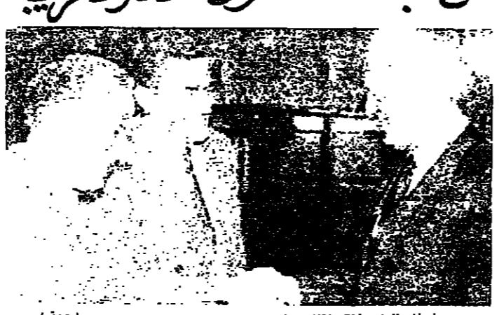
شيفاردا نازده خلال لقائه لاييسكو ووزير خارجية رومانيا